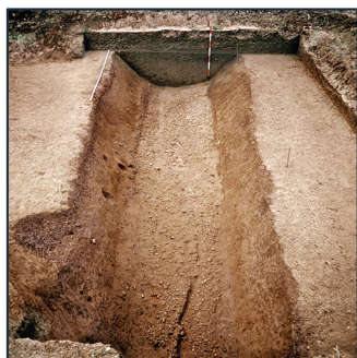
VEDUTE DI SCAVI DI CANALI DI BONIFICA

Le trasformazioni che si apprezzano nel territorio metapontino dopo la conclusione dell'esperienza tirannica, nella seconda metà del VI secolo, sono particolarmente rilevanti. Da questo momento la campagna si riempie gradualmente di fattorie, di piccoli impianti produttivi autonomi. Non si tratta di strutture che si localizzano solo nelle immediate adiacenze delle strade rurali o della necropoli urbana, ma d'insediamenti che raggiungono anche le zone più lontane. È credibile sia intervenuto un ampliamento del corpo civico.